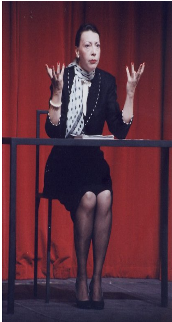
Le tailleur réalisé, photo de répétition