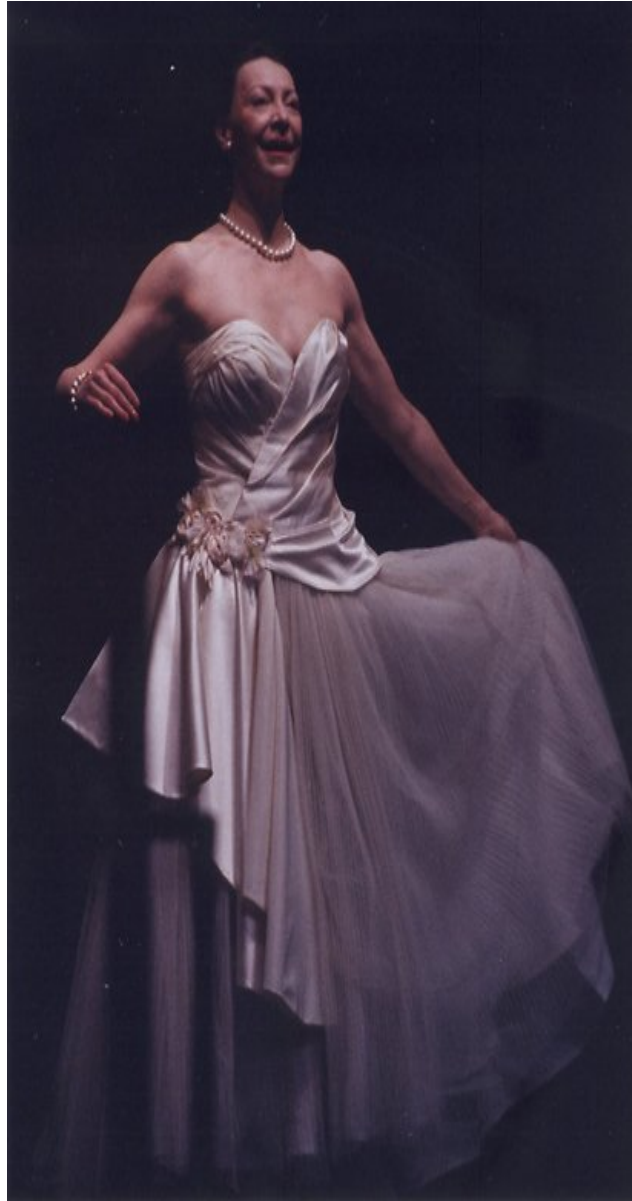
La robe réalisée, photo de répétition